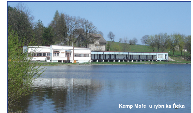
Kemp Moře u rybníka Řeka

ci sociální zařízení patřící k restauraci, jakož i WC a sprchy s teplou vodou, které stojí o kousíček výše v kempu ( sprchový automat na mince ). Hosté mají možnost parkovat svá auta přímo u kajut.