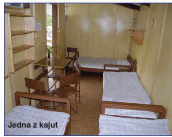
Jedna z kajut