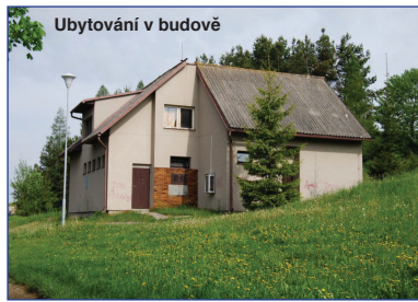
Ubytování v budově