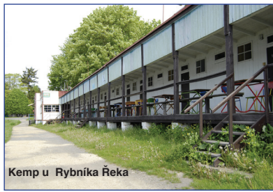
Kemp u Rybníka Řeka