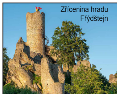
Zřícenina hradu Frýdštejn

Na Malé Skále se na strmém útesu nad řekou Jizerou tyčí skalní hrad Vranov , dnes známý spíše jako Pantheon . S délkou téměř 400 metrů je považován za nejkomplikovanější skalní hrad v Čechách. Po úzkém skalním schodišti můžete vystoupat na nejvyšší bod pískovcového útesu na Věž u Kříže . Hrad Vranov byl založen v 15. století jako