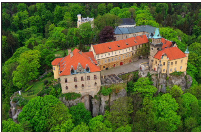
Zámek Hrubá skála

15. 5. 2022 12:55 až 15:45 hodin. Městský atletický stadion Ludvíka Daňka – Turnov , Skálova 207. Občerstvení na stadionu otevřeno: 11:30 až 16:00 hodin. Prosíme účastníky Stezky , vezměte si s sebou plastové kelímky na nápoje, třeba ty z loňské stezky!!! Parkování na Centrálním parkovišti. Král Stezky a Myš