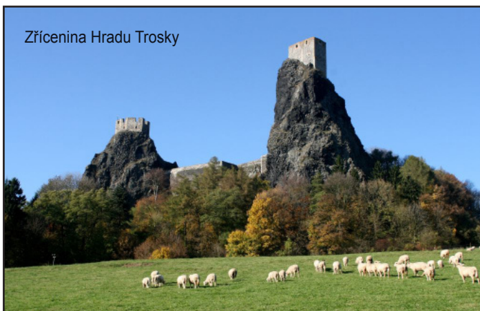
Zřícenina Hradu Trosky

Stezky – každá Trasa si vyrobí a přinese na zakončení dva kolíky přibližně 20 cm dlouhé, na konci seříznuté a označené číslem své Trasy. Soutěž Tras – spíše intelektuální. Téma: „Trosky“ časový limit 90 vteřin.